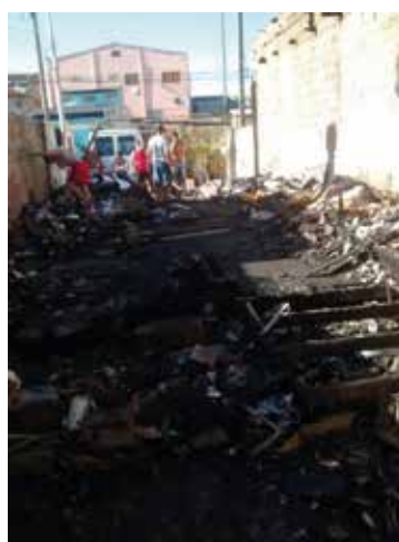
Após o desastre