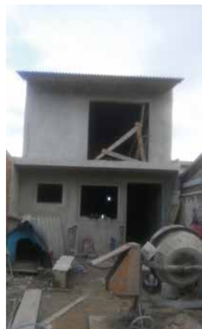
Após a solidariedade