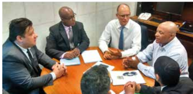
O Deputado João Paulo Papa.