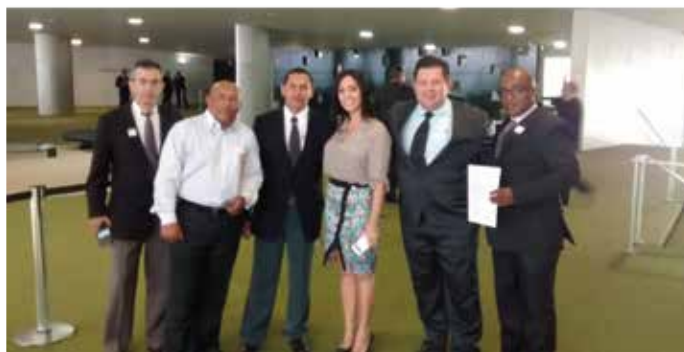
A Deputada Geovânia de Sá.