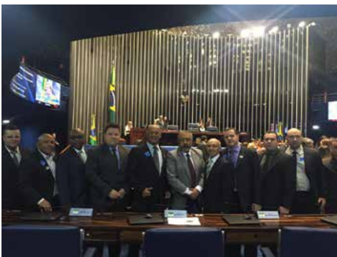
Pres. Silveira com o Senador Paulo Paim